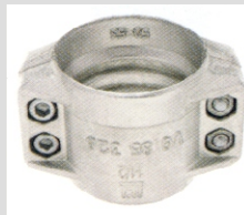
Klämbackar i Aluminium KSA Rostfri KSRF