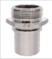
Utvändig gänga Rostfri KSR

Koppling rostfritt eller mässing. Kopplingarna används ihop med klämbackar i aluminium(KSA) eller rostfritt (KSRF).