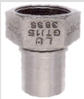
Invändig gänga Rostfri KSF