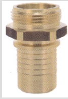
Utvändig gänga Mässing KSB