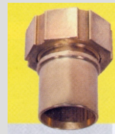
Invändig gänga Mässing KSG