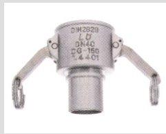
Camloc C-Typ Rostfri KSC